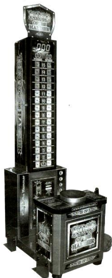
Modello SD Dimensioni: 550 X 900 X 2350 mm